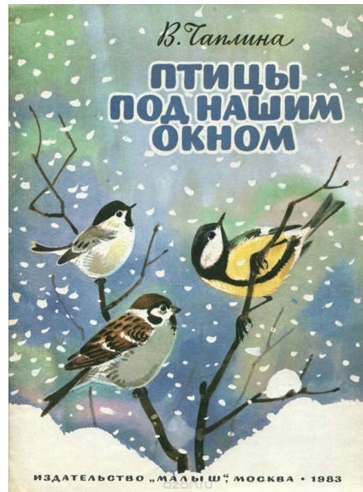
Книга № 2